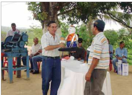
Roçadinho treina, certifica e premia seus colaboradores