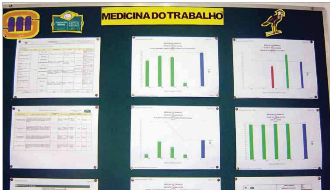
Metas e Indicadores na Roçadinho: objetivos alcançáveis